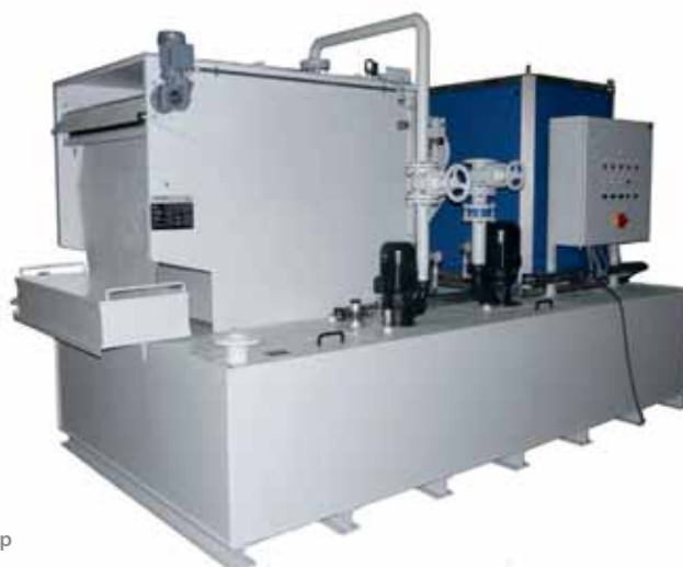
Наклонный ленточный фильтр