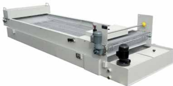
Гравитационный ленточный фильтр